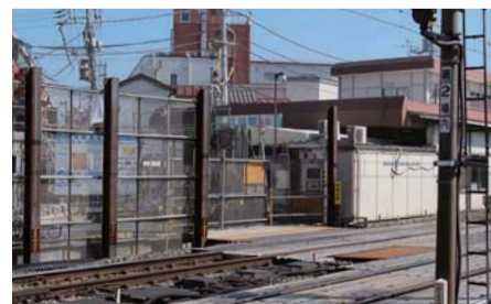
工事が始まった沼袋駅