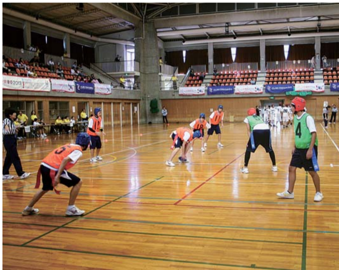
フラッグフットボール (同左)