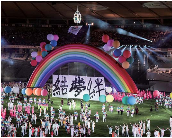
開会式 式典演技 (味の素スタジアム)