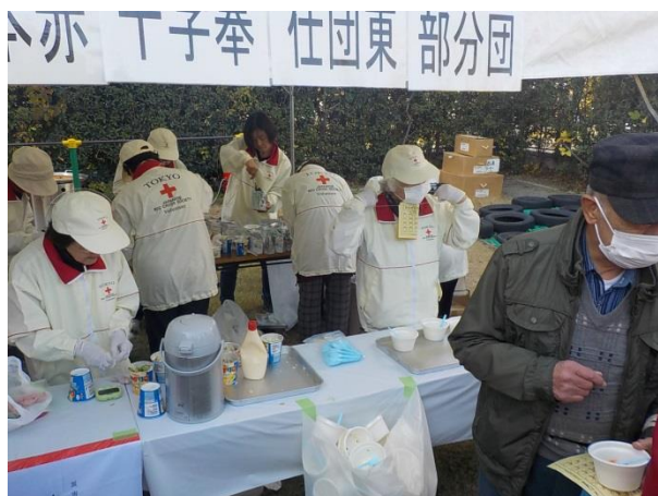
サバイバルクッキング(東部)