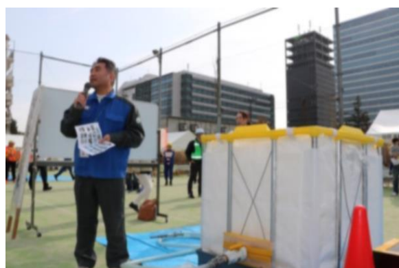
応急給水訓練(新井)