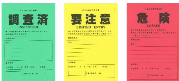
施設点検・応急危険度判定訓練(新井)