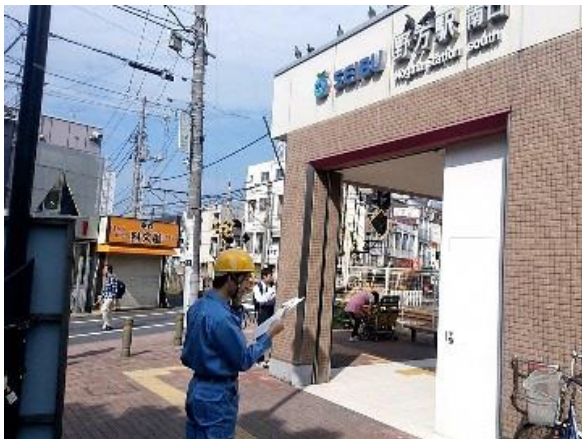
帰宅困難者対策班到着 (野方駅南口)