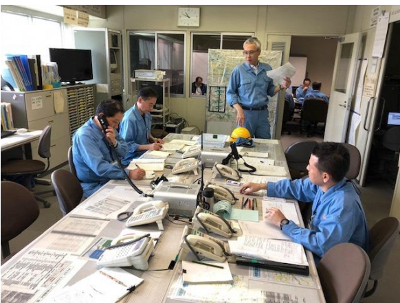
班員からの無線を受信する班長 (中野区防災センター)