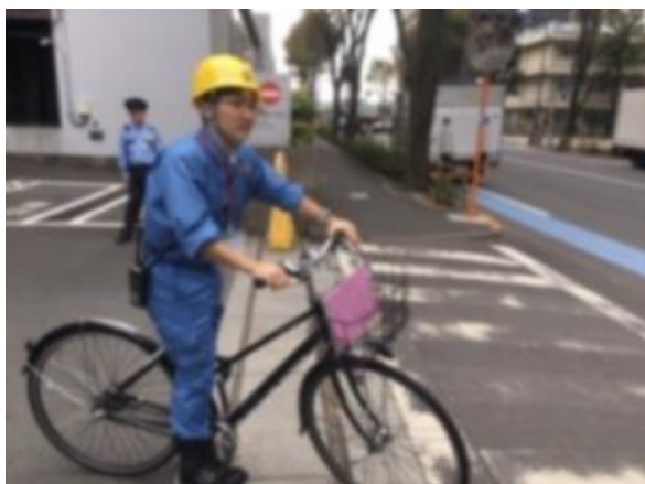
現地へ出向する帰宅困難者対策班