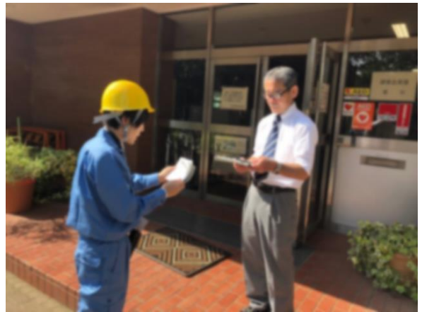
帰宅困難者対策班情報伝達訓練 (武蔵丘高校)