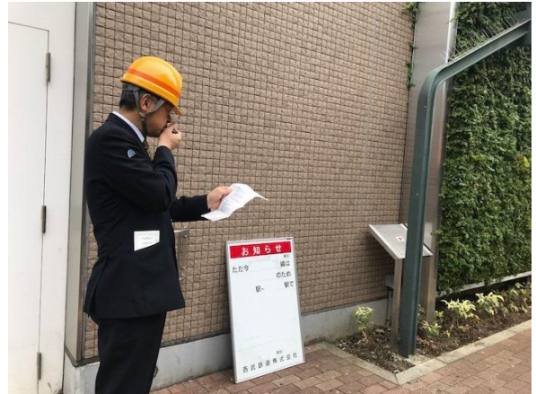
情報提供ステーション開設訓練 (野方駅南口)