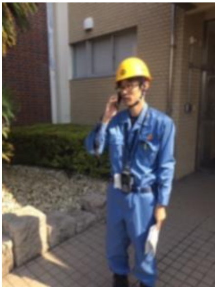
帰宅困難者対策班到着 (稔ヶ丘高校)