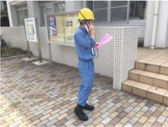
帰宅困難者対策班到着 (鷺宮高校)