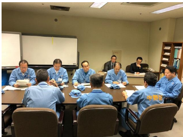
災害対策本部長室