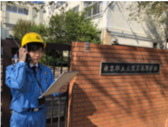
帰宅困難者対策班到着 (武蔵丘高校)