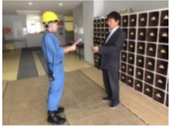
帰宅困難者対策班情報伝達訓練 (鷺宮高校)