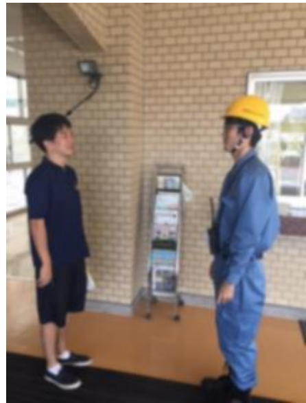
帰宅困難者対策班情報伝達訓練 (稔ヶ丘高校)