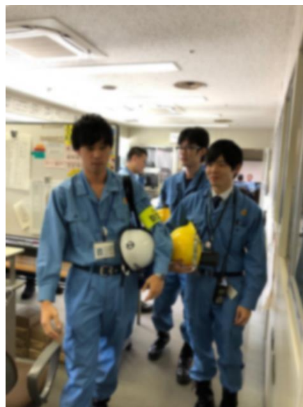
帰宅困難者対策班出向