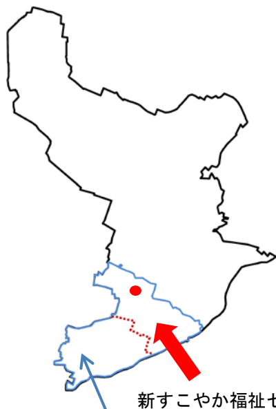
新すこやか福祉センターの圏域

新設するすこやか福祉センターの圏域における 世帯数・人口等 （平成30年1月1日現在）