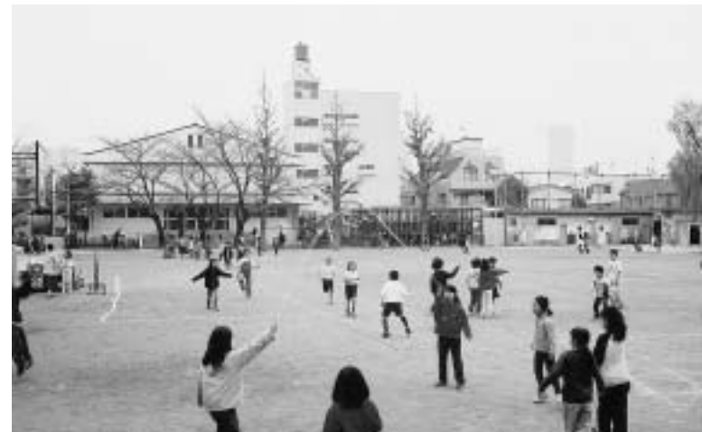
休み時間に遊ぶ子どもたち

区長 都の「用途地域等に関する指定方針及び指定基準」を踏まえ、また区都市計画マスタープランに定める土地利用方針を基本として、要領案を作成する。素案を区報やホームページで公表するとともに、各地域センターで説明会を開催し、区民の意見をいただく。意見は、都市計画審議会で審議した上で、6月には区原案として取りまとめる予定である。