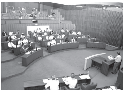
第2回定例会(6月21日)の本会議の様子