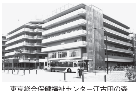
東京総合保健福祉センター-江古田の森

区長 児童票の一部が見当たらないという事故報告を受け、改めて調査を徹底するよう指示した。