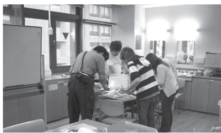
障害者通所施設の作業風景

①利用料の応益負担の撤回を国に求めるべきではないか。②区独自の利用負担の軽減策や、民間事業所の運営費補助を検討すべきでは。③施設の新体系事業移行に伴い、都の支援策を活用して運営を支援すべきでは。④作業所に対し、区の仕事の優先発注などの対策を行うべきでは。