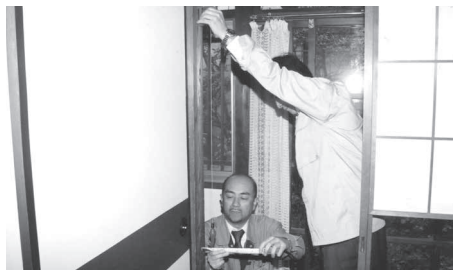
木造住宅の耐震診断