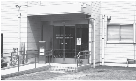
地域包括支援センター

区長 ①24時間365日、サービスが提供できる区役所を目指して、サービス提供機関の開発、自動交付機やコールセンターの活用など、できるだけ早く検討を進める。②ワンストップサービスの窓口を、なるべく早い時期に整えるように検討していく。