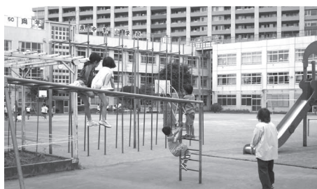
学校開放で遊ぶ子どもたち

区長 ①地域の意見を踏まえ、よりよい活用をしていきたい。今年度のできるだけ早い時期に区の家を固め、地域の皆さんとも協議していきたい。②東中野小跡地を含め、この地域における育成活動の