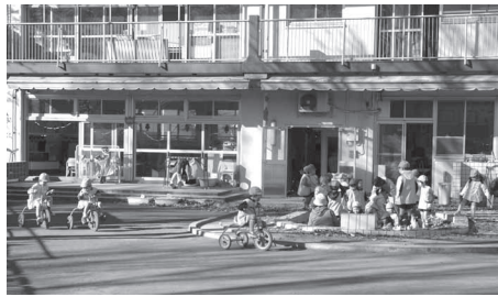
幼稚園で遊ぶ子どもたち

JRにあるようだがどうか。 区長 業務施設の移転と改修により今年度内にスロープを設置することを検討中と聞いている。