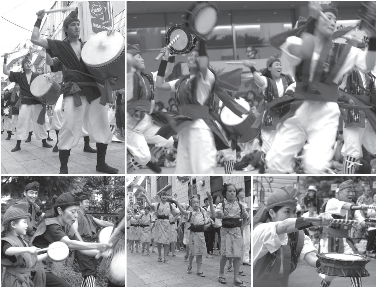
中野チャンプルーフェスタ 2007

〒164-8501 中野区中野4-8-1 電話 3228-5585 FAX 3228-5693 Eメール kugikaijimu@city.tokyo-nakano.lg.jp ホームページ http://kugikai.city.nakano.tokyo.jp/