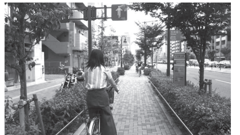
山手通りの自転車通行帯