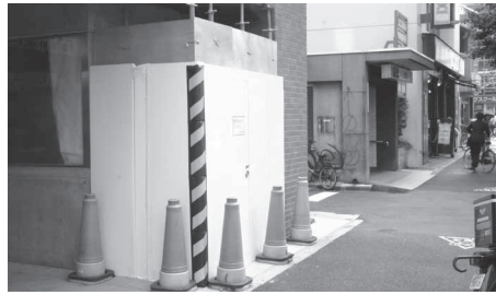
新中野駅エレベーター工事

桃園第三小、仲町小、桃丘小の統合新校の整備工事のねらいと、工事の具体的内容は、 区長 既存校舎の保全工事のみならず、子どもたちの活動を支援する整備工事をはじめ、バリアフリー対策や防犯対策、耐震機能強化、省エネルギー対策など、安全で快適な施設整備を目指している。