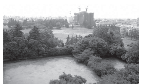
警察大学校等跡地

画案に立ち返るべきでは。区長 ①協力金は、中野駅周辺の都市基盤施設整備で、著しい受益事業者に自分の金銭的協力を求めるもので、開発者負担の原則に変わらぬ。②05年の中野駅周辺まちづくり計画に基づき、土地の処分なども行われている。計画案の見直しはしない。