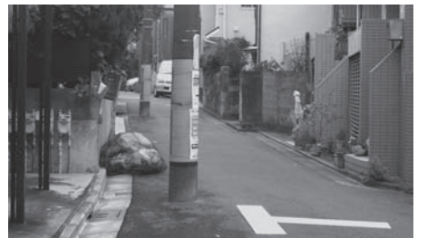
道路に残された電柱

地域防犯会などへの印刷物の配布により区民に周知していく。また、速やかに利用者の安全を確保する対応については検討中である。②都の状況を見ながら、区の事業継続計画を策定していきたい。