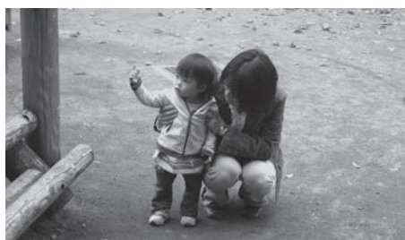
公園でお母さんと

診時の平均負担額6千円を3回分支給する拡充を行った。現在のところ、現行の5回の公費負担を維持したい。