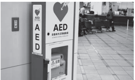
区役所に設置されたAED

区長 ①収容能力の限界から、希望者全員の利用は保証されていないが、機会は公平に提供している。②第九中学校跡地への移転整備を10か年計画のステップ4以降に位置付けている。次期改定期に具体的な構想を示していきたい。③地元自治体が購入するのが最善であるが、動向も見極め、早期売却に向けて協議を進めていきたい。④建物を含めた価格での売却は困難であるが、早期に未利用地が解消するよう努めていきたい。