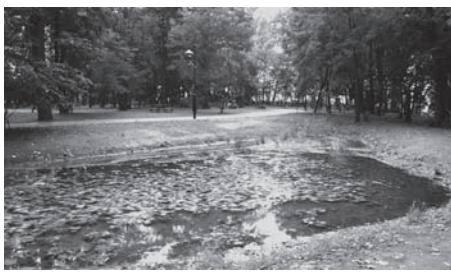
江古田の森公園ビオトープ

水害時の情報提供を充実し 区民の安全を確保せよ ①一昨年の水害を機に、都 が設置した、野方の妙正寺川 取水施設や神田川の監視カメ ラの映像を区に配信し、公開 するよう強く要望してはどうか。 ②過去の被災状況をもと に、高齢者や障害者の状況を