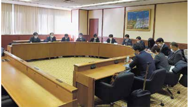
令和3年12月23日(木)から24日(金)に、愛知県の「日本マイクロソフト株式会社との連携・協力に関する包括協定の締結について」と静岡県袋井市の「マイナンバーカードの普及・活用について」の視察を行いました。写真は愛知県での様子です。