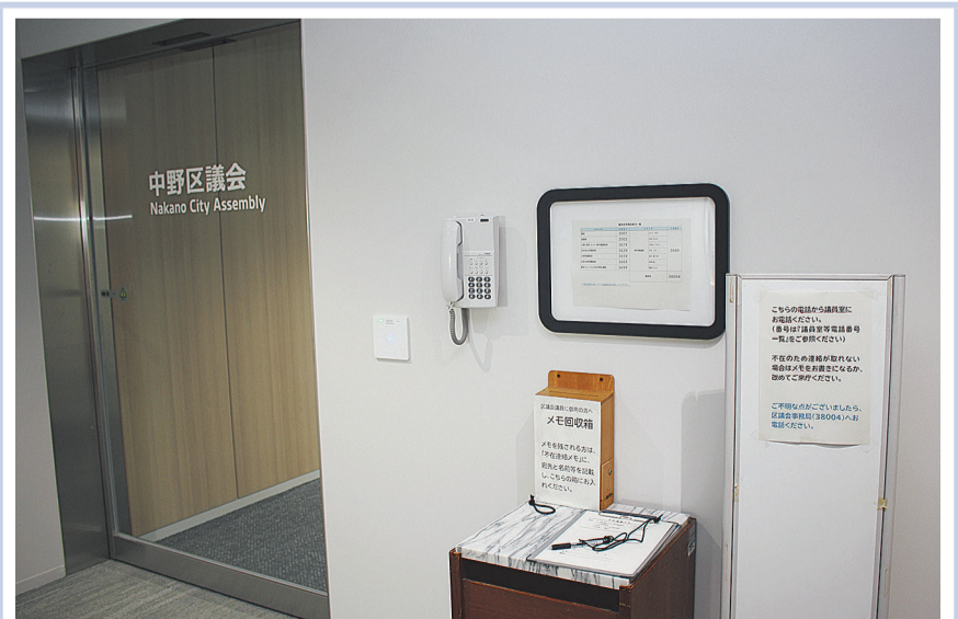
議員室に御用の方は、10階でエレベーターを降りた左手奥に設置されている電話にて、ご連絡いただけます。(⑥)