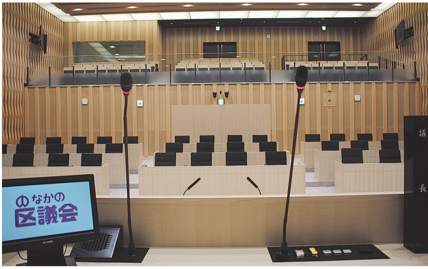
議長席から眺める本会議場

本会議場内の壁には、区民の様々な声に耳を傾ける姿勢をモチーフとしたルーバー形状を旧庁舎の本会議場から継承しています。 また、天井から取り込む自然光と木材で明るくやわらかな本会議場としました。