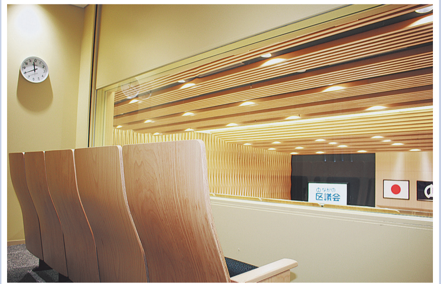
小さなお子様連れの方が傍聴できるよう、親子傍聴席をご用意しています。(②)