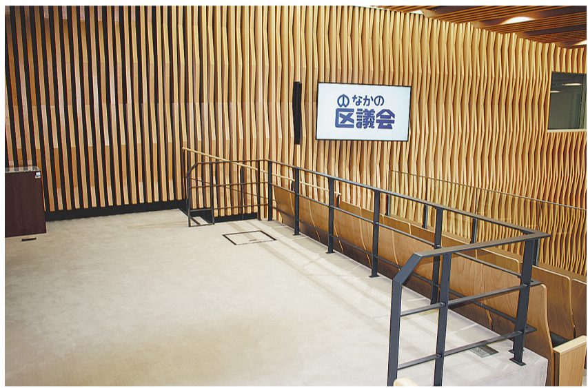
車椅子の方が傍聴できるよう、車椅子用席としてのスペースをご用意しています。(11面レイアウト図の① ※以下番号のみ掲載)