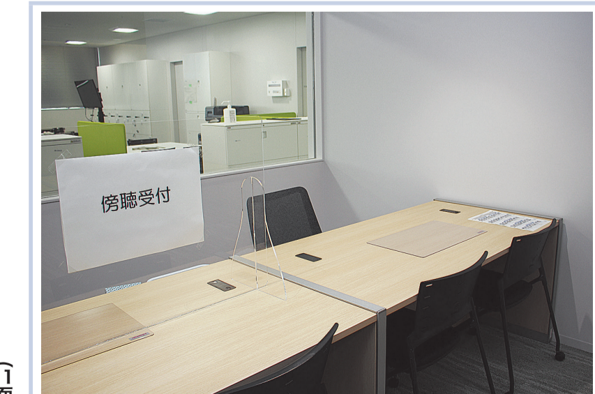
傍聴手続きは、10階の区議会事務局にて、会議開催の1時間前から受け付けています。傍聴に関する詳しい説明は3面をご覧ください。(⑤)