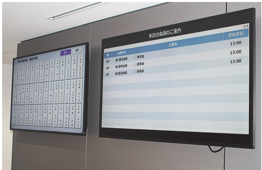
10階エレベーター前に、当日の会議予定が確認できる案内表示を設置しています。(③)