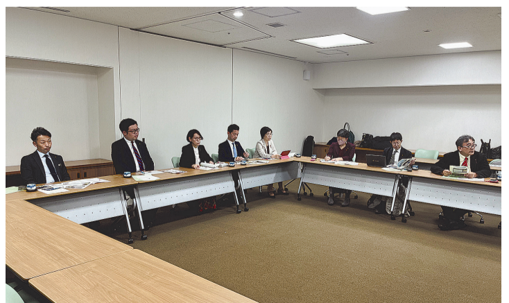
11月6日(水)から11月7日(木)に、福岡県福岡市の「スタートアップ公共調達サポート事業」について、福岡県の「県有施設における脱炭素化計画」について視察を行いました。写真は福岡市での様子です。