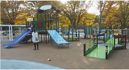
都立砧公園のインクルーシブ遊具

インクルーシブ公園は、障害の有無や年齢・性別・国籍などに関係なく、みんなが楽しく遊べる公園のことである。