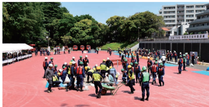
5月20日(火)に江古田の森公園で行われた中野区合同水防訓練の様子