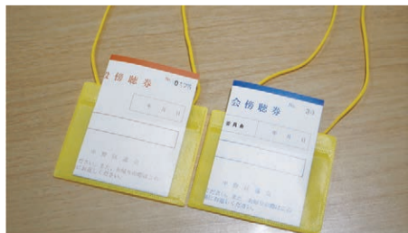
傍聴券及びストラップ