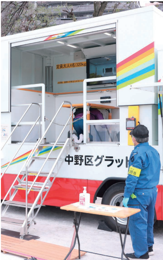
5月25日(日)に宝仙学園中学校・高等学校で行われた防災体験デーの様子