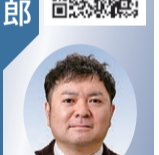
立憲・国民・ネット・無所属議員団 問 ひとみ

①スキマバイトアプリを活用した学童クラブ等の職員を募集した事例に対し、こども家庭庁は、望ましくないとす