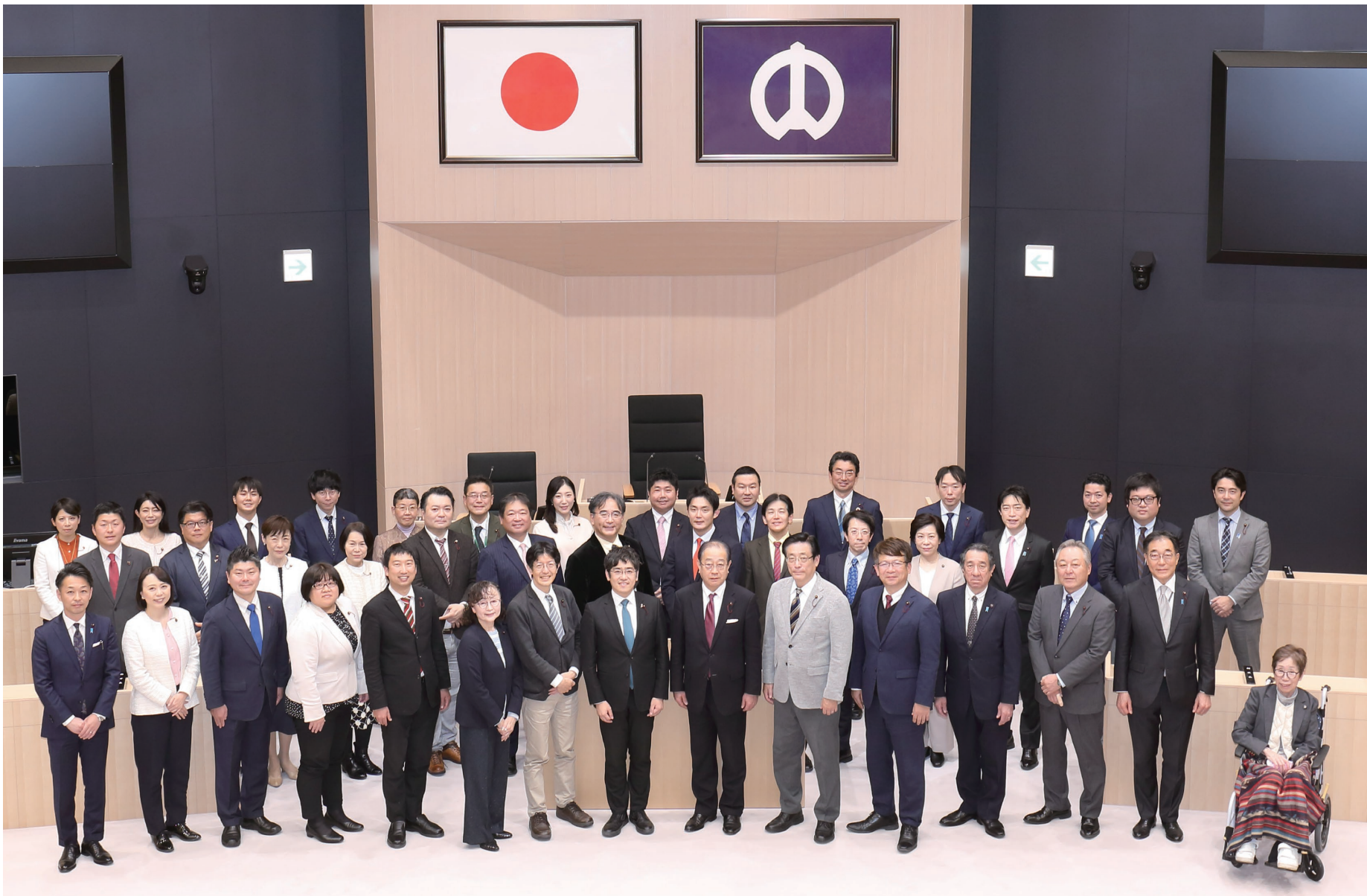
第24期中野区議会議員(区議会本会議場にて)

明けましておめでとうございます。 区民の皆様におかれましては、希望に満ちた新春をお迎えのこととお慶び申し上げます。また旧年中は、中野区議会の活動に対し、深いご理解とご協力を賜り、心から御礼を申し上げます。 昨年11月に発生した大分市佐賀関の大規模火災は、人的被害が生じ、建物被害においては170棟以上となる事態になりました。火災拡大要因の一つと考えられる、建物が近接し、大きな道もなく、燃えやすい木造の建物がつながっている状況は、区内でも類似している地域が存在している状況です。防災対策の重要性について再認識するとともに、引き続き災害に強い安全な中野のまちづくりを推進してまいります。