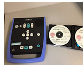
左：再生機 右：デジター図書