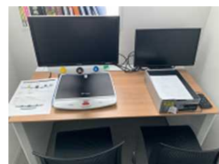
左：拡大読書器 右：よむべえ