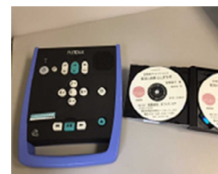
左：再生機 右：デジター図書