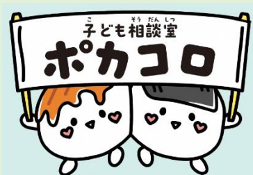
▲子どもたちの選考により決定した子ども相談室「ポカコロ」とマスコットキャラクター「だんごず」