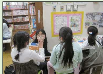
▲子ども総合計画(素案)の子ども向け意見交換会の様子