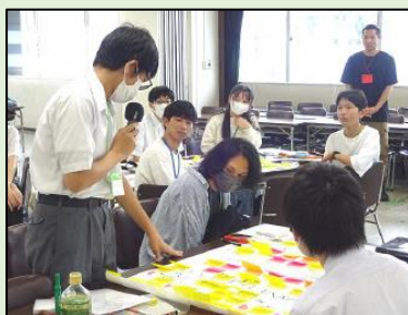
◀ 令和5年度ハイティーン会議の様子