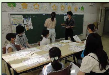
▲ワークショップの様子