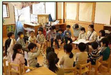
▲区内保育園で乳幼児にヒアリングを行っている様子