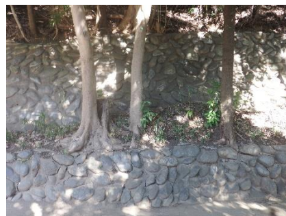
造化澗の石積（建設年不明）