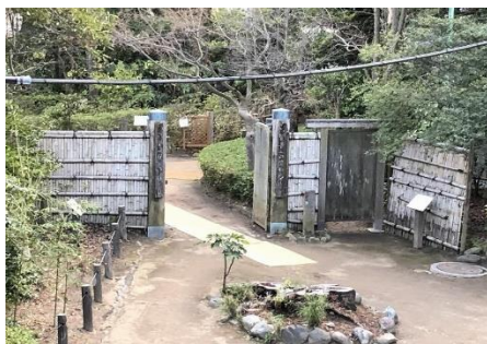
常識門（明治 42～45 年建設）