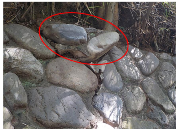
石積のせり出し状況