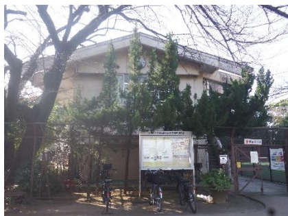
管理棟（昭和 53 年建築）