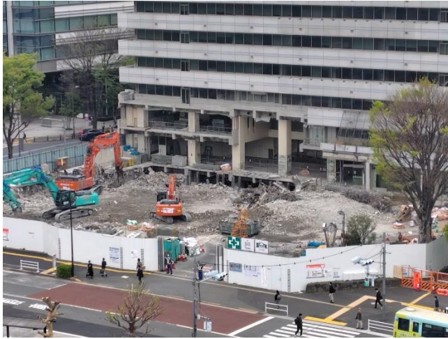
旧区役所低層棟の解体状況