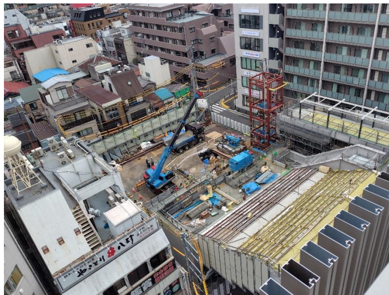
桃園広場側の工事状況

中野駅西側南北通路の桃園広場側降し口については、中野駅西口改札開業に向けて工事を進めている。現在は、デッキ上部工等の工事を進めている。