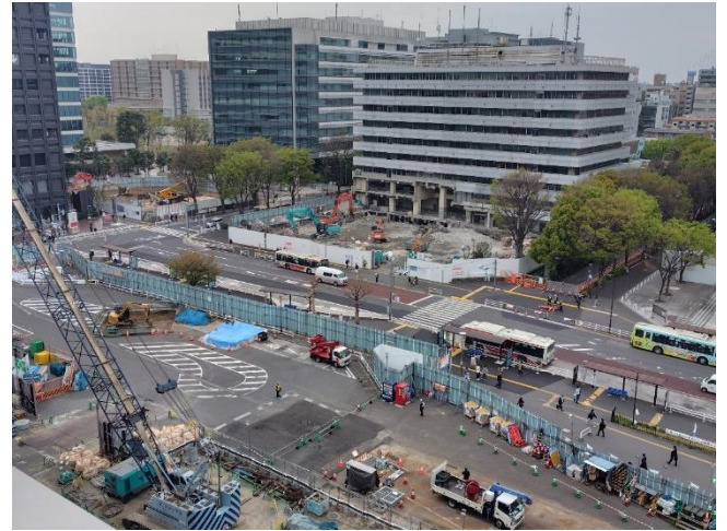
ペDESTリアンデッキ下部工の基礎工事の状況